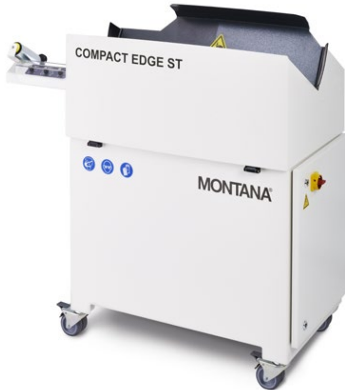
ABMESSUNGEN COMPACT EDGE ST / COMPACT EDGE S